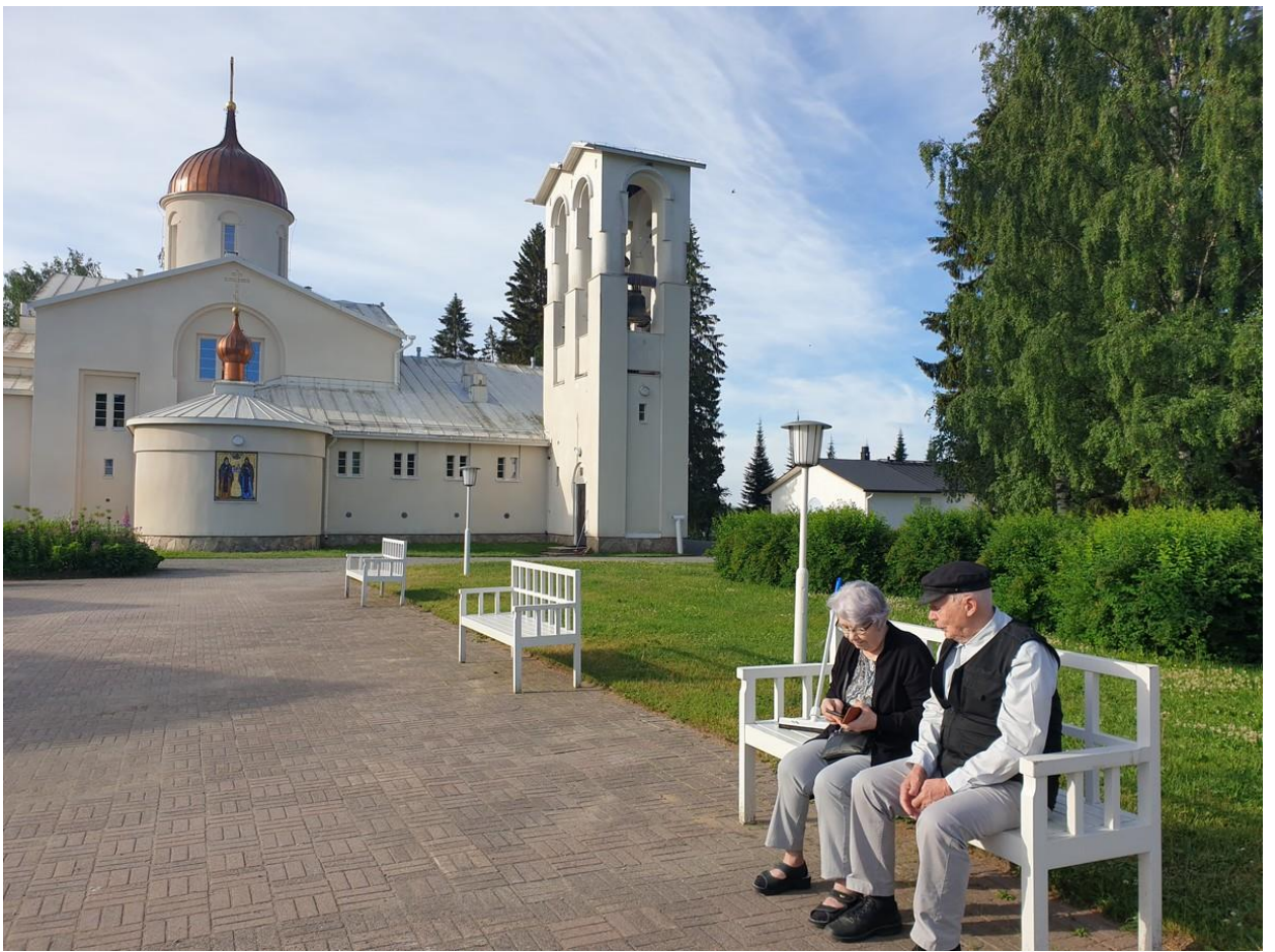
Nissiset digitunnilla Valamon keskusaukiolla!