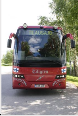
Tillgren Lines Oy