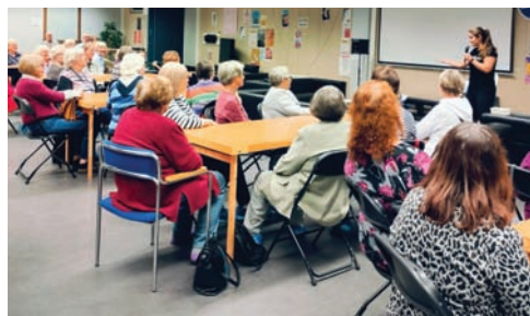
Torstaikerhossa infoa liikunnasta.