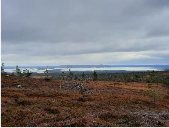
Riisitunturi (Riisin räpäsäy 4,3km)