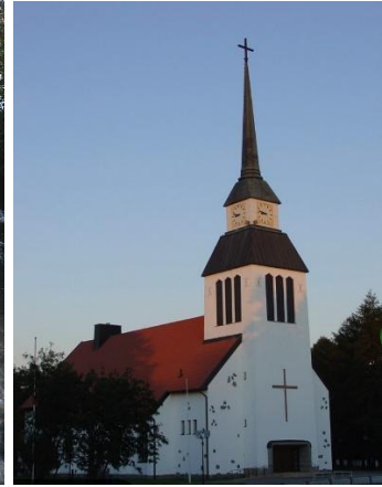
Pyhä Laurin Kirkko Kuusamo